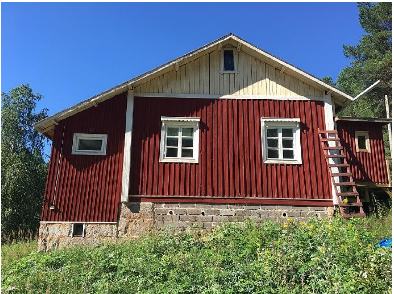
Kaustaran tilan päärakennus kesällä 2020.